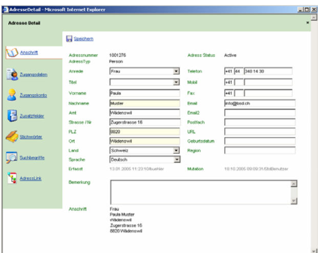
Die komfortable Verwaltung der Kursteilnehmer macht es so einfach.

Die Lösung vereint viele Vorteile: Der administrative Aufwand wird deutlich reduziert und eine direkte und schnelle Kommunikation sorgt für zufriedene Teilnehmer. Diese können sich jetzt online informieren, erhalten automatisch alle benötigten Unterlagen und können direkt buchen. So wird die Administration spürbar entlastet. Von dieser Lösung profitieren alle, die mit weniger Aufwand mehr erreichen möchten.